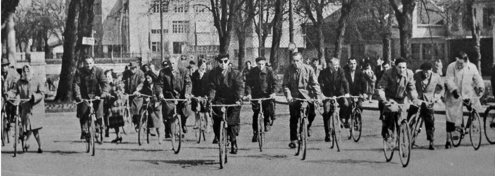
Croisée du Casino, sortie des usines Paillard, Yverdon 1960